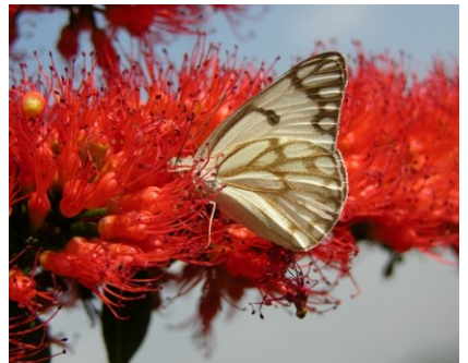
Fakkii 1 ffaa . Bunni gaaddisa mukeen bosonaa jalatti guddatu biqiltoota fi bineeldota adda addaatiif bakka jireenyati. Qorannoo keenya kana keessaatti mukeen gurguddaa fi biqiltoota xixiqqoo gara garaa irratti xiyyeeffanne (Suuraawwan sadan tarree ol'aanurra jiran).